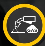
MIG/MAG FLUX CORED CON GAS