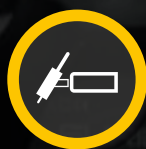
TIG / GTAW