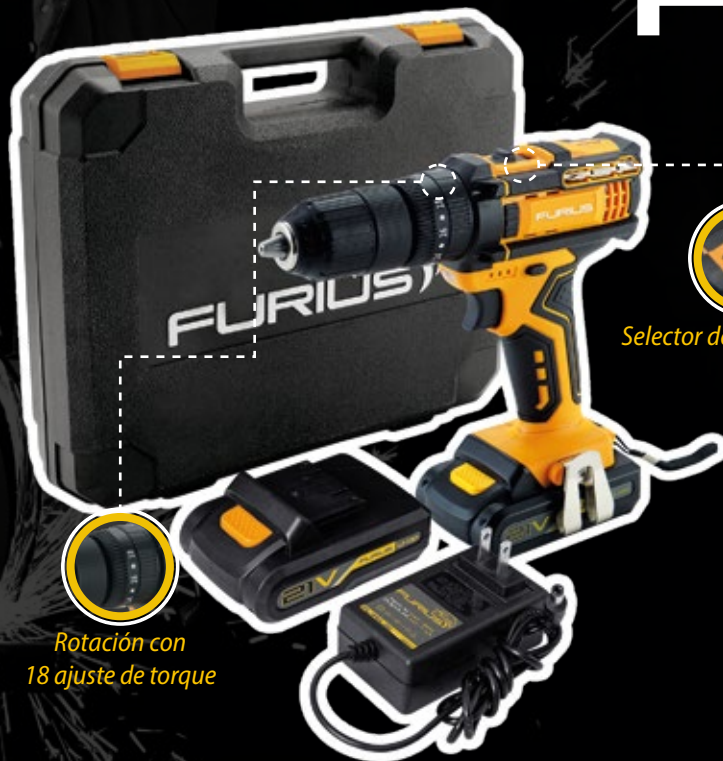
Selector de 2 velocidades