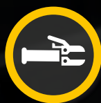
MMA / SMAW