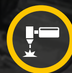
PAC - CORTE POR PLASMA