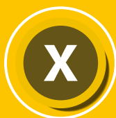
CICLO DE TRABAJO